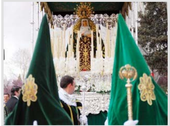
El paso de palio de Nuestra Señora de la Esperanza a su paso por la Carretera de Carrión.